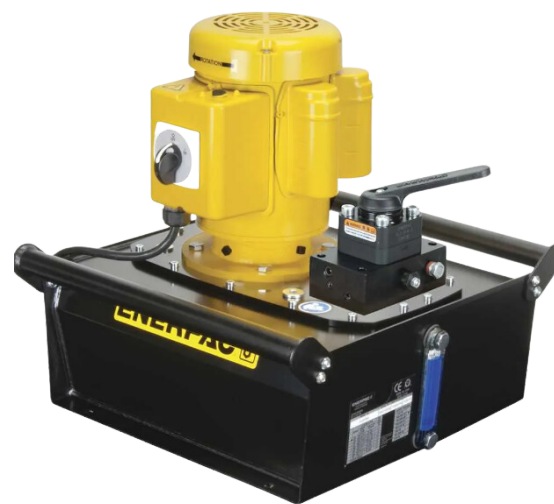
BOMBA HIDRAULICA ELÉTRICA