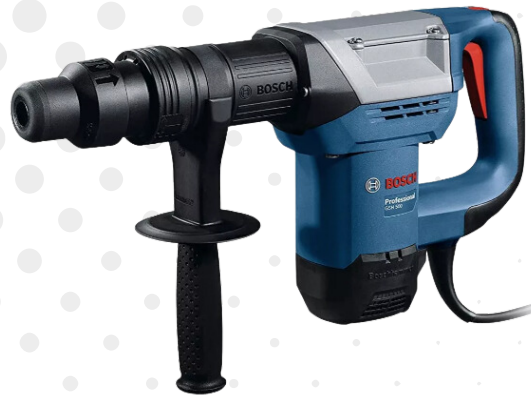
MARTELO PERFURADOR 5KG