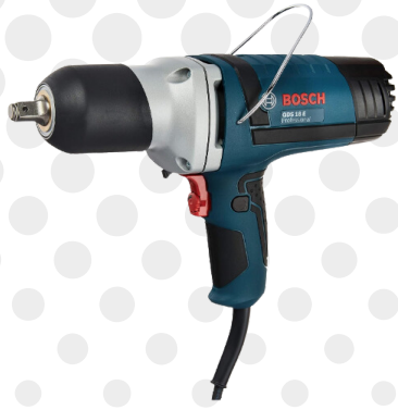
CHAVE DE IMPACTO 5/8