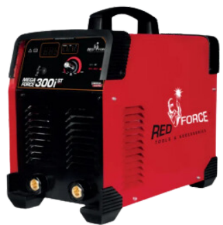
INVERSOR DE SOLDA MEGA FORCE 300I