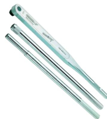
TORQUÍMETRO 10 A 3000NM