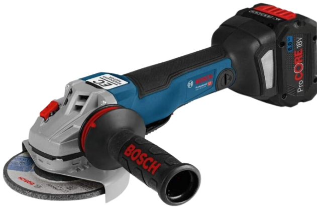
ESMERILHADEIRA À BATERIA 5"