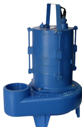
BOMBA SUBMERSA 2'