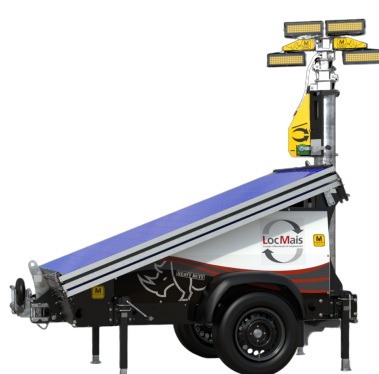
TORRE DE ILUMINAÇÃO SOLAR