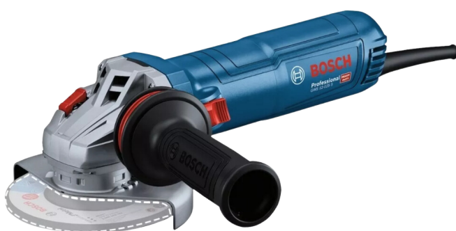
ESMERILHADEIRA 5' (COMUM E KICK BACK STOP)