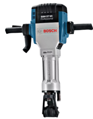
MARTELO DEM. 30 KG SEXTAVADO