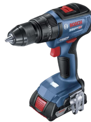
FURADEIRA À BATERIA 1/2 E 3/4