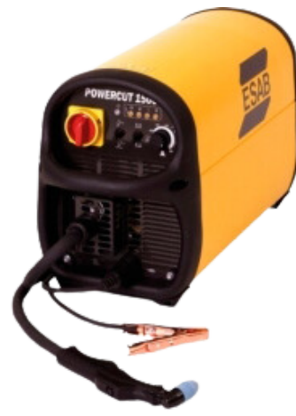
MÁQUINA DE PLASMA POWERCUT 1500