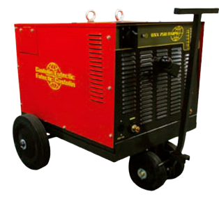
MÁQUINA DE SOLDA BAMBOZZI 750 A