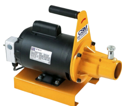
MOTOR VIBRADOR DE CONCRETO