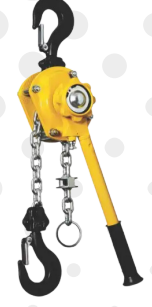
TALHA ALAVANCA 750 KG A 9 TON