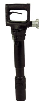
MARTELO PNEUMÁTICO TEX 11