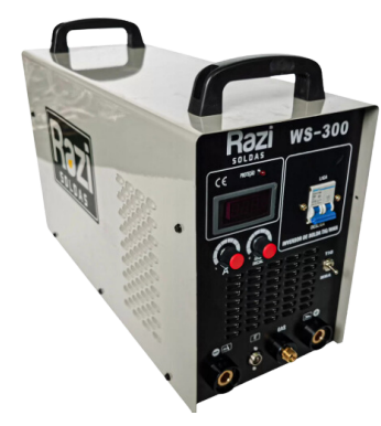
INVERSOR DE SOLDA RAZZI ARC300