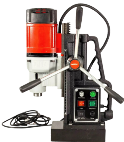
FURADEIRA BASE MAGNÉTICA 5/8