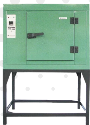
FORNO P/ ELETRODO