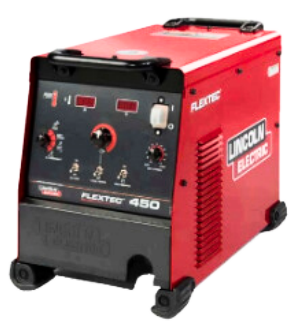
INVERSOR DE SOLDA FLEXTEC 450