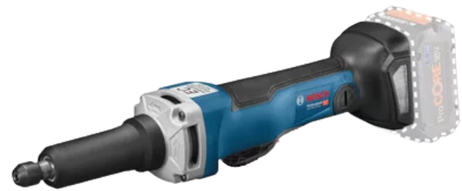
RETÍFICA À BATERIA