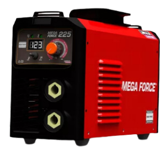
INVERSOR DE SOLDA MEGA FORCE 225