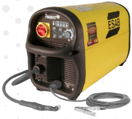
MÁQUINA DE PLASMA POWERCUT 1250