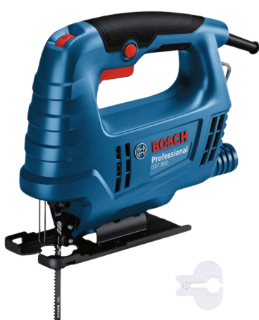
SERRA TICO TICO