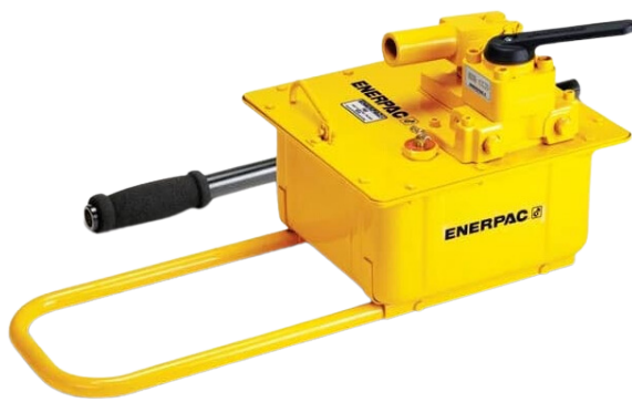
BOMBA HIDRAULICA P462 / P464