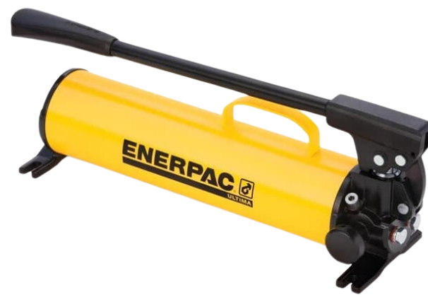
BOMBA HIDRAULICA P80