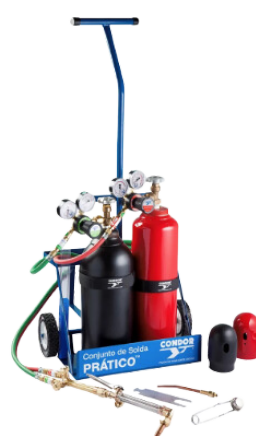
CONJUNTO DE OXICORTE