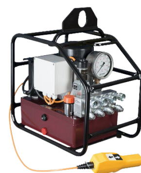
BOMBA DE TORQUE P/ TORQUEADEIRA