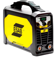
INVERSOR DE SOLDA ESAB