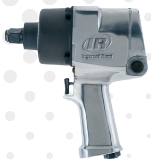
CHAVE DE IMPACTO PNEUMÁTICA 3/4