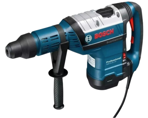
MARTELO PERFURADOR 10 KG SDS MAX