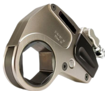
CHAVE DE TORQUE LINK ATUADOR