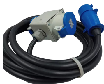
EXTENSÕES 220 / 380V / 440V