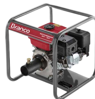
MOTOR VIBRADOR DE CONCRETO GASOLINA