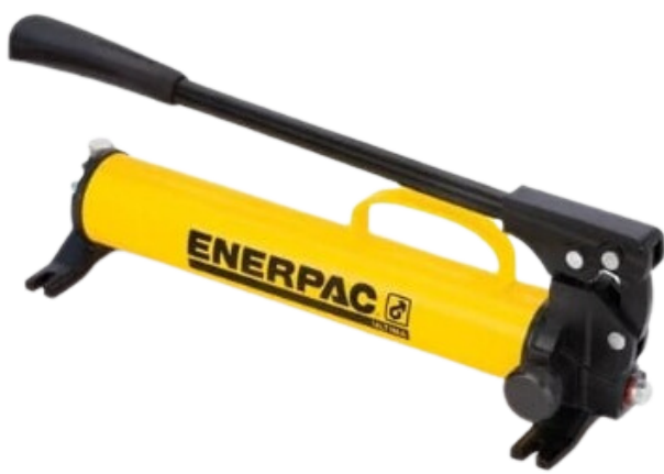
BOMBA HIDRAULICA P39