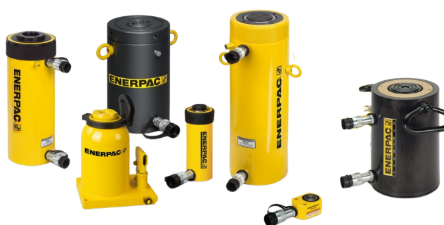
CILINDROS HIDRÁULICOS 10 A 400 TON