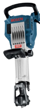
MARTELO ROMP. 18 KG SEXTAVADO