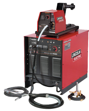
MÁQUINA MIG LINCOLN CV 400I