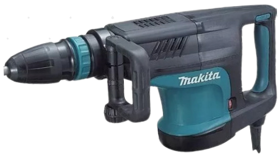
MARTELO ROMPEDOR 10 KG SDS MAX