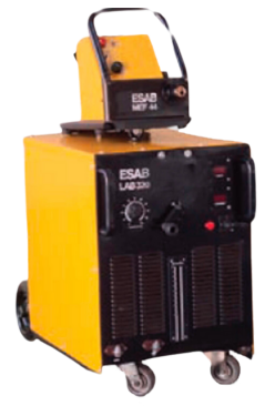
MÁQUINA MIG ESAB LAB 475