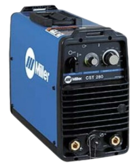
INVERSOR DE SOLDA MILLER CST 280