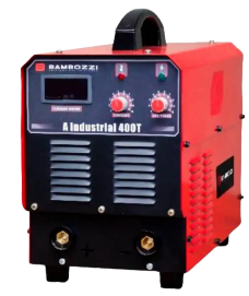
INVERSOR DE SOLDA BAMBOZZI 400T