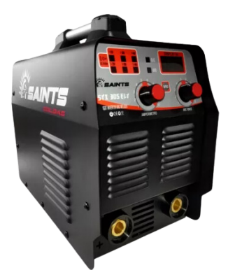
INVERSOR DE SOLDA SAINTS STX 305