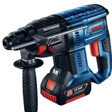
MARTELETE A BATERIA 2 KG PERFURADOR