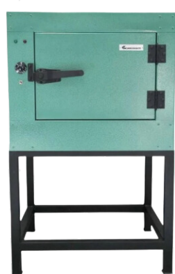
ESTUFA P/ ELETRODO