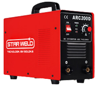
INVERSOR DE SOLDA ARC 200