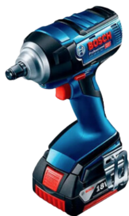
CHAVE DE IMPACTO A BATERIA 3/4