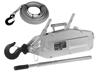
TIRFOR 1,6T A 5,4 TON