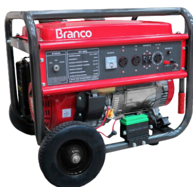
GERADOR 8 KVA