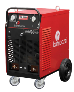
MÁQUINA DE SOLDA BAMBOZZI 850 A