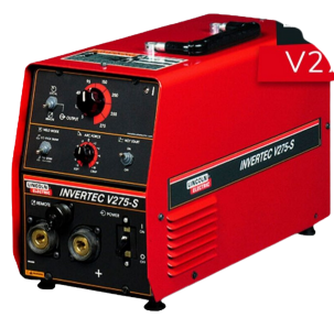
INVERSOR DE SOLDA INVERTEC V275