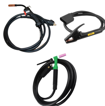
TOCHAS MIG / TIG / GRAFITE