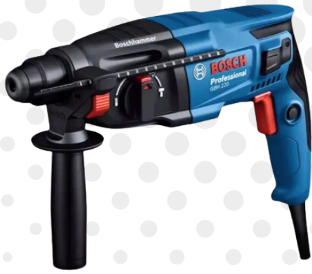
MARTELO PERFURADOR 2 KG