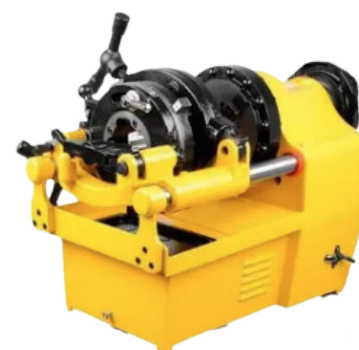
ROSQUEADEIRA FERRARI INDUSTRIAL