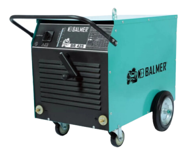
MÁQUINA DE SOLDA BALMER 425 A